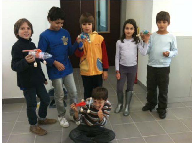
Six des huit enfants inscrits aux ateliers « Petits Stimuliens » 2010/2011 lors de la séance sur les petites voitures

Physique : Suite et fin des ateliers expérimentaux du 1 er trimestre.