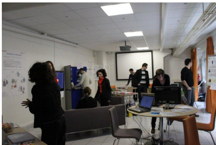
Le village des sciences du festival ; photo Stimuli©

Nous avons pu rencontrer un public varié et présenter à travers diaporama et démonstration sur plateforme internet nos activités.