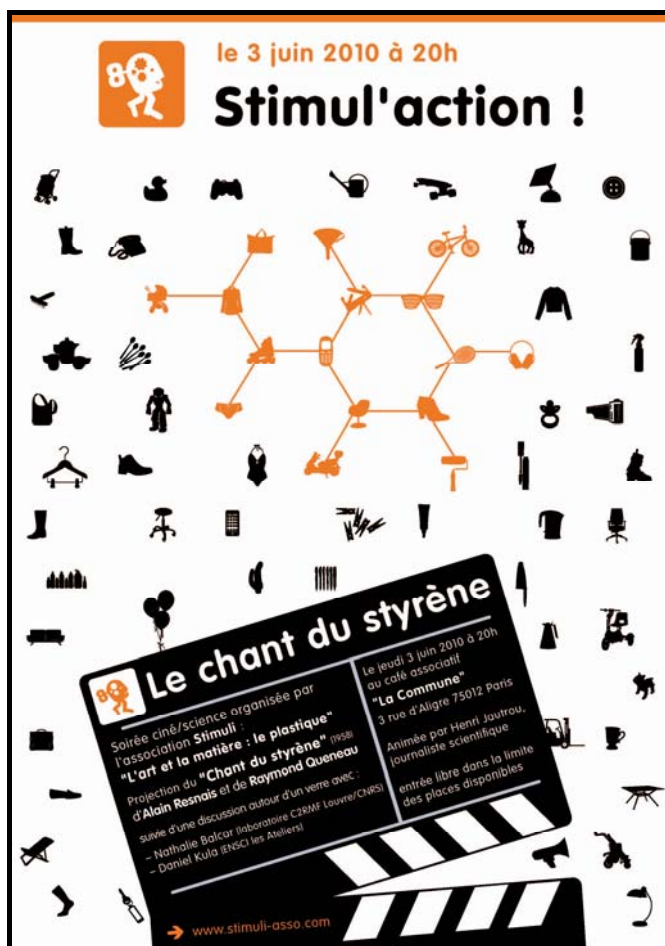
Affiche du Stimul'Action du 3 juin 2010 (conception www.lézard-graphique.net )

Le premier Stimul'Action a eu lieu le 3 juin 2010 en soirée. Le film projeté était un moyen métrage d'Alain Resnais (1958), « Le Chant du Styrène », qui traite de la fabrication de la matière plastique.