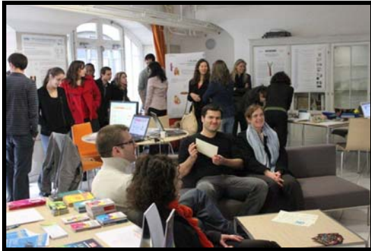
Le public venu visiter le village des sciences du festival ; photo Stimuli©