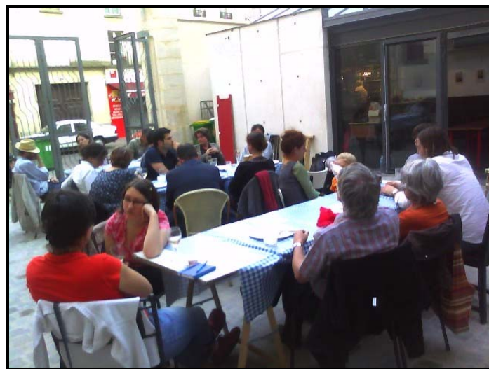
Le public en terrasse du café La Commune avant la projection

Cette opération sera reconduite en 2011 sous une forme pérenne qui reste à déterminer.