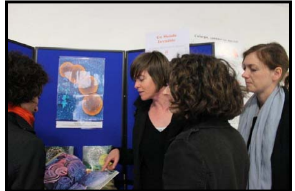
Les membres de Stimuli autour du « Un Monde invisible » et de l'exposition des images extraites du livre ; photo Stimuli©

Nous avons pu rencontrer un public varié et présenter à travers diaporama et démonstration sur plateforme internet nos activités.